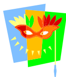
Abbildung 1 Dahinter verbirgt sich ein Faschingskrapfen