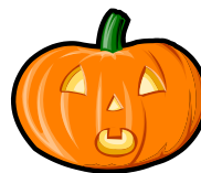
Abbildung 3 Das ist ein Kürbis